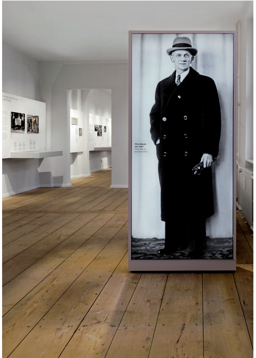
Otto Weidt, um 1942 Otto Weidt, around 1942.